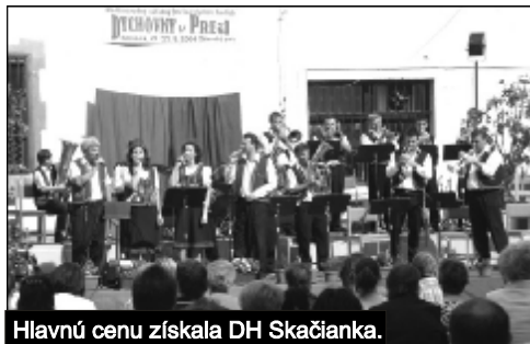
Hlavnú cenu získala DH Skačianka.