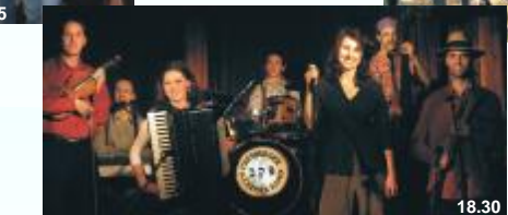
PRESSBURGER KLEZMER BAND sobota 19. 9.