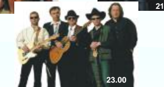
BUKASOVÝ MASÍV piatok 18. 9.