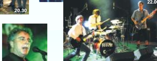
FEELME sobota 19. 9.