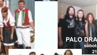
PALO DRAPÁK BAND sobota 19. 9.