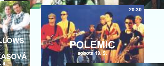
POLEMIC sobota 19. 9.