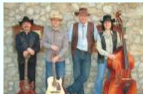
21.45 ARION piatok 18. 9.

Mestské informačné centrum v budove Pezinčského kultúrneho centra tel.: + 421 33 640 69 89 e-mail: micpezinok@gmail.com , www.pezinok.sk