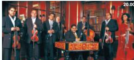
CIGÁNSKI DIABLI sobota 19. 9.