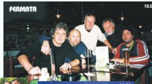
FERMATA nedeľa 20. 9.