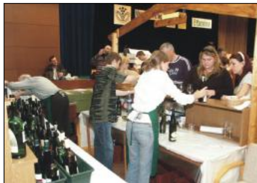
Pri stánkoch bolo rušno.