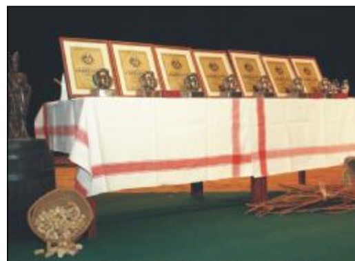
Ceny pre šampiónov – bronzová busta Bakchusa a diplomy.