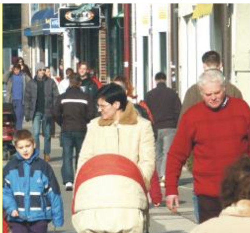
Ilustračné foto (mo)