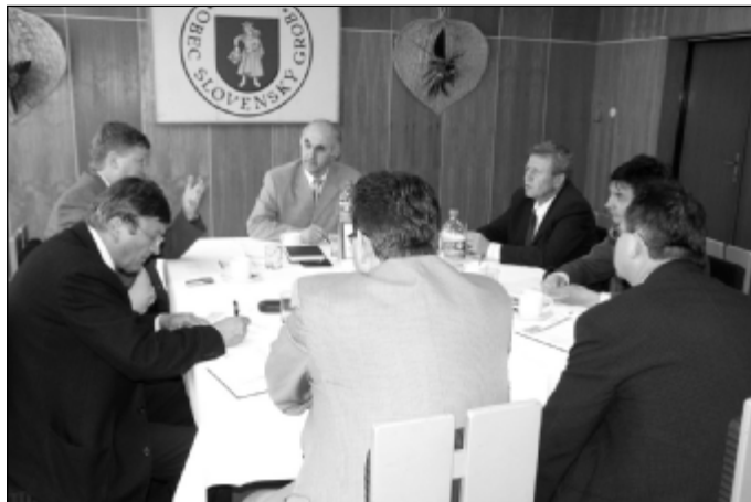
Z rokovania v Slovenskom Grobe.

Ďalšie zasadnutie združenia sa uskutoční 7. júna v Pezínku. (mo)