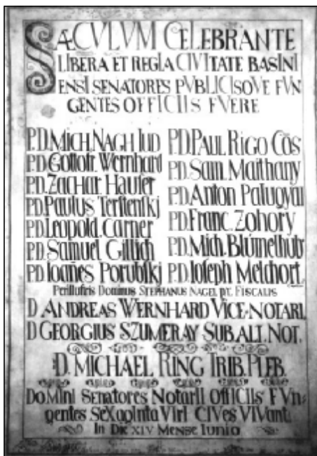
Menoslov mestskej rady z r. 1747.

Vladimíra Büngerová Malokarpatské múzeum v Pezinku