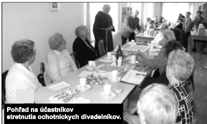
Pohľad na účastníkov stretnutia ochotníckych divadelníkov.

Blížšie o činnosti krúžku budeme informovať v budúcom čísle. (mo)