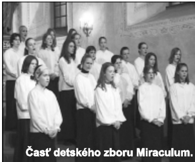
Časť detského zboru Miraculum.

vystúpenia v Dolnom kostole, evanjelickom kostole a v kaplnke v Pinelovej nemocnici. Okrem toho zahraničné zbory účinkovali spoločne - na Červenom Kameni a na záver všetci účastníci na galakoncerte.