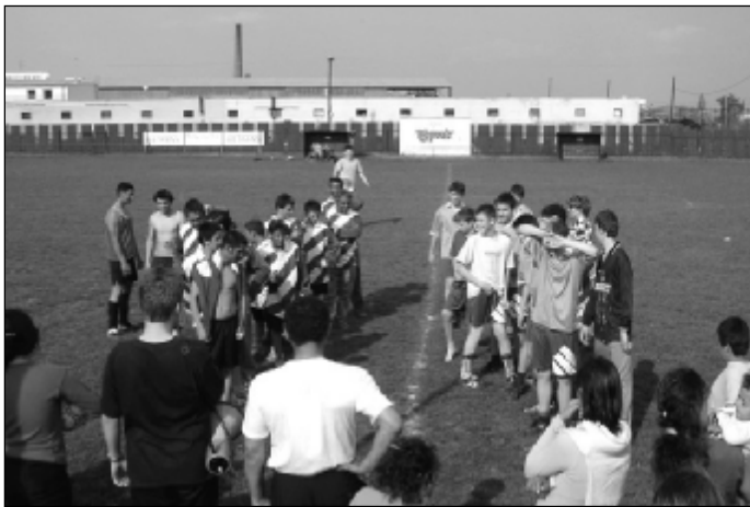
Aktéri futbalového zápasu na ihrisku GFC.

Mesto Pezinok ďakuje firme Bageta za veľkorysú materiálnu podporu a Centru voľného času za spoluprácu pri organizačnom zabezpečení tohto podujatia. (EL)