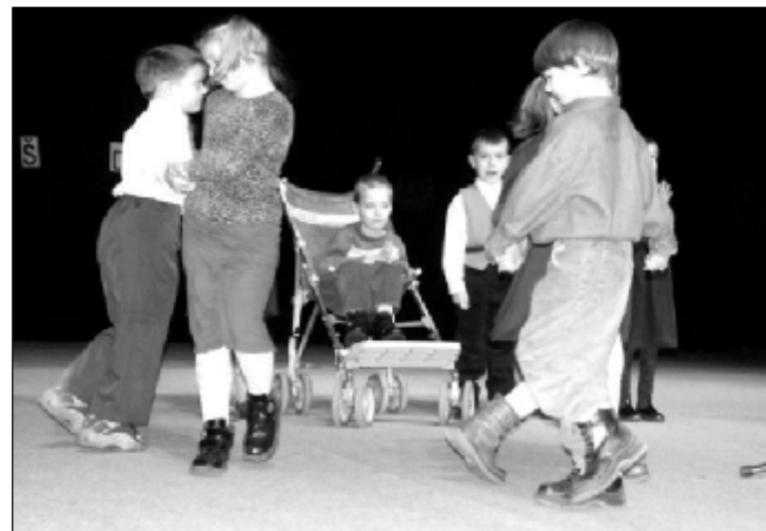
Vystúpenie detí z Materskej školy na Vajanského ulici.