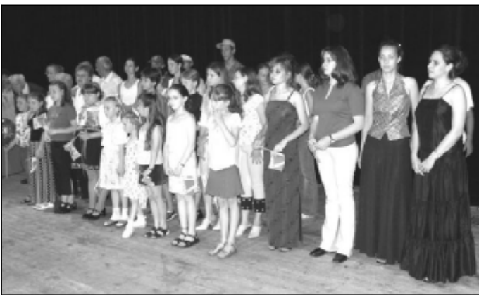
Súťažiaci s napätím očakávajú vyhlásenie výsledkov.

Ani vyše tridsaťstupňová horúčava neodradila vari tristo Pezinčanov, aby prišli v druhú júnovú nedeľu do Domu kultúry na jubilejný piaty ročník celomestskej súťaže Pezinok spieva - spievajte s nami. Tí čo prišli určite neobanovali, pretože výkony viacerých súťažiacich boli ozaj kvalitné.