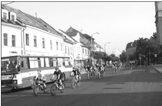
Účastníci cyklomaratónu sa vydávajú na 200 km trať.

vzali pamätné listy za absolvovanie dvojdňového cyklomaratónu. Väčšina účastníkov prejavila záujem zúčastniť sa na podobnej akcii aj v budúcom roku. Organizátori ďakujú vláde SR, resp. MF za finančnú podporu tohto podujatia. (EL)