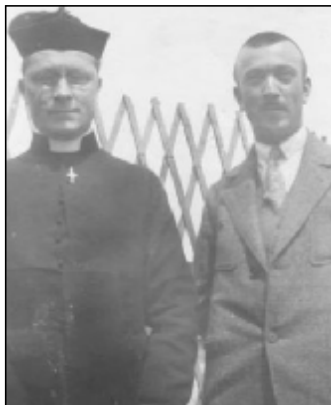
Na tejto snímke sú už s vymenenými miestami a vážnejšími tvármi.