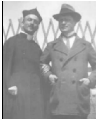
Tu sú znovu s vymenenými miestami a prekvapujúco aj s vymenenými odevmi.