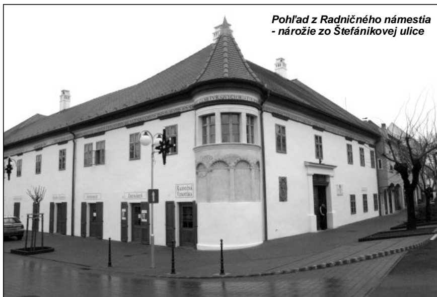
Pohľad z Radničného námestia - nárožie zo Štefánikovej ulice