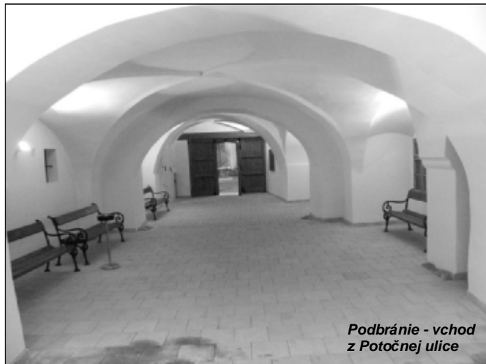
Podbránie - vchod z Potočnej ulice