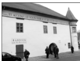
Pohľad z Potočnej ulice