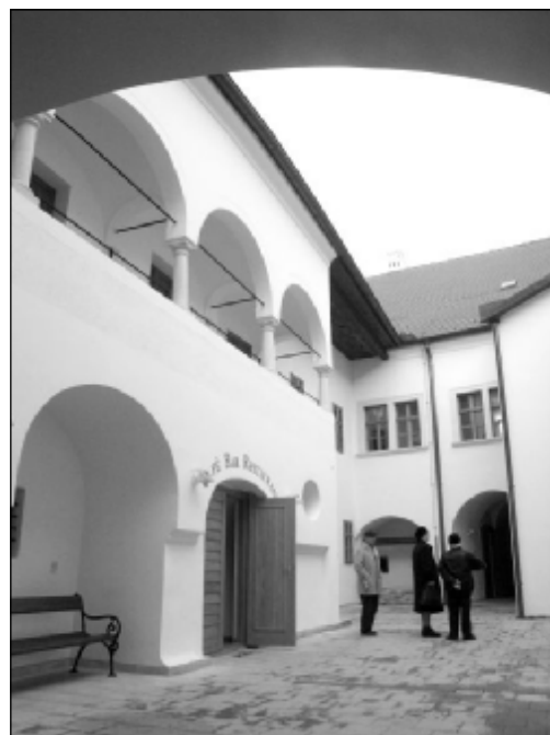
Pohľad na nádvorie z Potočnej ulice