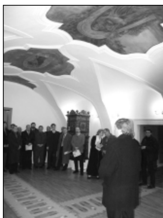
Miestnosť mestskej rady