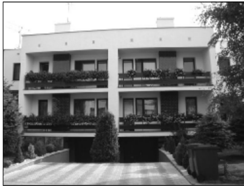
Dom Petra Schwammela na Štúrovej ulici 51.