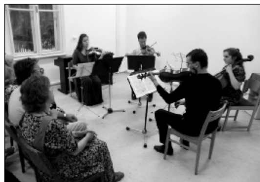
Zo záverečného slávnostného koncertu.