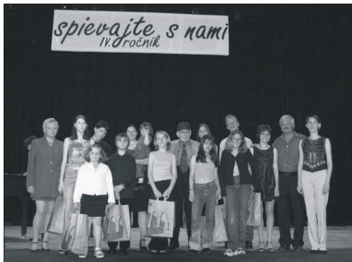
Snímka zachycuje najúspešnejších súťažiacich.

Záujemcovia volajte na č. 033/641 3443 od 7.00 do 15.30 hod.